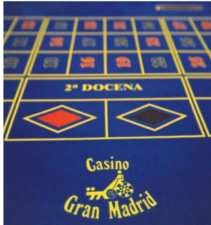
Mesa de juego del Casino Gran Madrid.

Además, la Agencia Tributaria también pone el foco por primera vez en la relación de agentes autorizados para emitir publicidad relacionada con estas actividades de juego así como en sus certificados de seguridad informática.