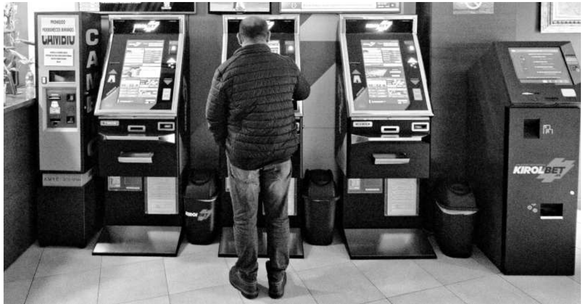
Un usuario realizar una apuesta en un salón de Pamplona.

La encuesta EDADES realizada por el Ministerio de Sanidad en 2017, refleja que el 60,2% de la población española de 15 a 64 años ha jugado dinero en los últimos doce meses de forma on line y/o presencial. Según el informe, las personas que juegan de forma presencial han experimentado un incremento del 37,4% en 2015 al 59,5% en 2017. Quiene juegan on line han crecido del 2,7% en 2015 al 3,5% en 2017.