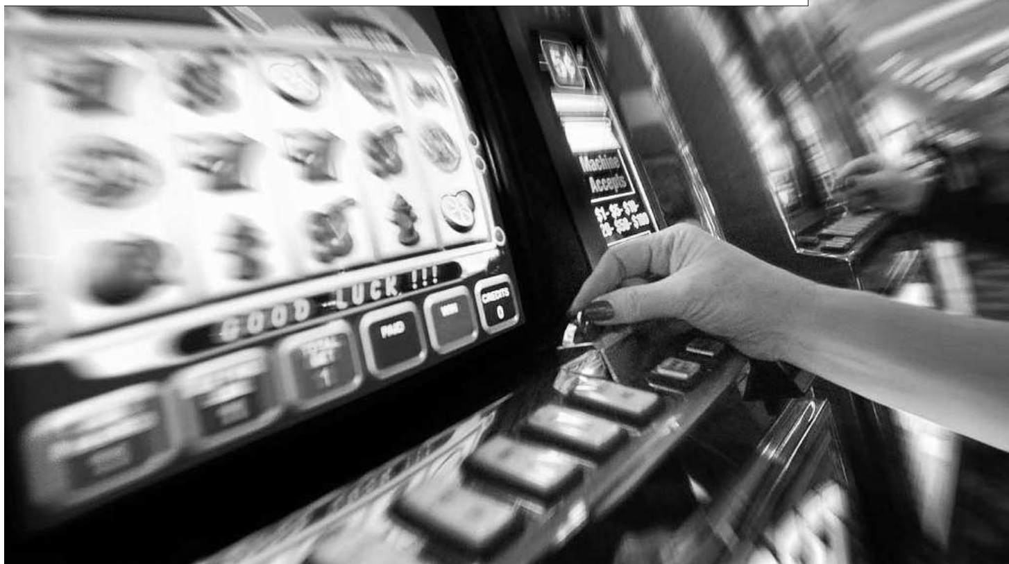
Los salones de juego y las casas de apuestas se han multiplicado en Euskadi hasta cifras récord.

Ayer se celebró el Día del Juego Responsable en un momento en el que la sociedad vasca ha puesto la lupa sobre los salones de juegos y los locales de apuestas deportivas, que se han multiplicado en Euskadi.