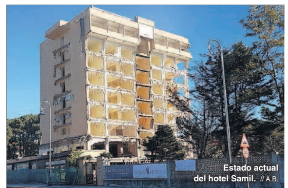
Estado actual del hotel Samil.

Está previsto que los trabajos de desmontaje de la torre finalicen en marzo para luego completar la ejecución del nuevo hotel en un plazo de año y medio. Tendrá mucha menos altura que el actual inmueble que llevaba años abandonado y trata de integrarse en el entorno. La intención es que pueda abrir sus puertas a lo largo de 2020 para reforzar la oferta hotelera a pie de playa.