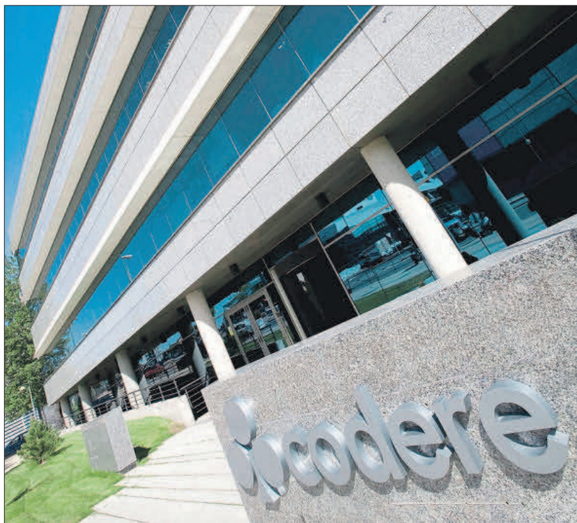
Sede de Codere. EE

Fuentes de Codere, que también cuenta con negocio en la zona, consideran que el negocio online es global y los grandes jugadores mundiales aprovechan también las oportunidades fiscales. A su vez las empresas de juego estarían revisando también su fuerte crecimiento en salones, donde ha pasado de ape-