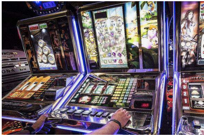
Un hombre juega en el interior de un salón de recreativos de una ciudad de la Comunidad.

Al respecto, el presidente de la Federación Castellana y Leonesa de Jugadores de Azar Rehabilitados, Ángel Aranzana, criticó que las casas de apuestas «no escogen su ubicación al azar, sino con premeditación y alevosía». «El juego supone un problema progresivo tanto en España como en Castilla y León», lamenta Aranzana. Una denuncia que ha llevado a la asociación, junto a Izquierda Unida, a presentar esta semana una PNL en las Cortes para que la ludopatía se considere como una adicción dentro del Plan de Drogas de Castilla y León. De esta forma, Aranzana denunció que la región es de las pocas que no tienen la ludopatía en