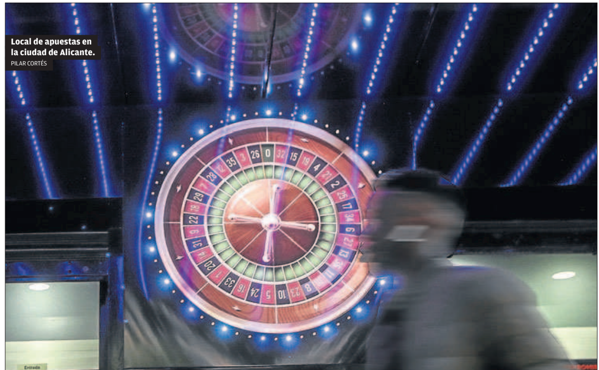
Local de apuestas en la ciudad de Alicante.

El Consell ya ha anunciado que modificará el reglamento de salones recreativos y juego para incluir una distancia mínima de 700 metros entre los establecimientos. La anterior normativa establecía el mínimo en 800 metros. La nueva