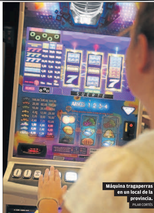
Máquina tragaperras en un local de la provincia.