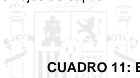
CUADRO 11: BALANZA DE PAGOS

extranjeros ( incluido el apoyo contingente de los bancos de "mainland", es decir de China continental) acompañado de una regulación financiera prudente limitan el riesgo de volatilidad de los flujos de capital.