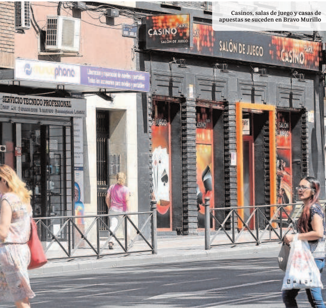
Casinos, salas de juego y casas de apuestas se suceden en Bravo Murillo