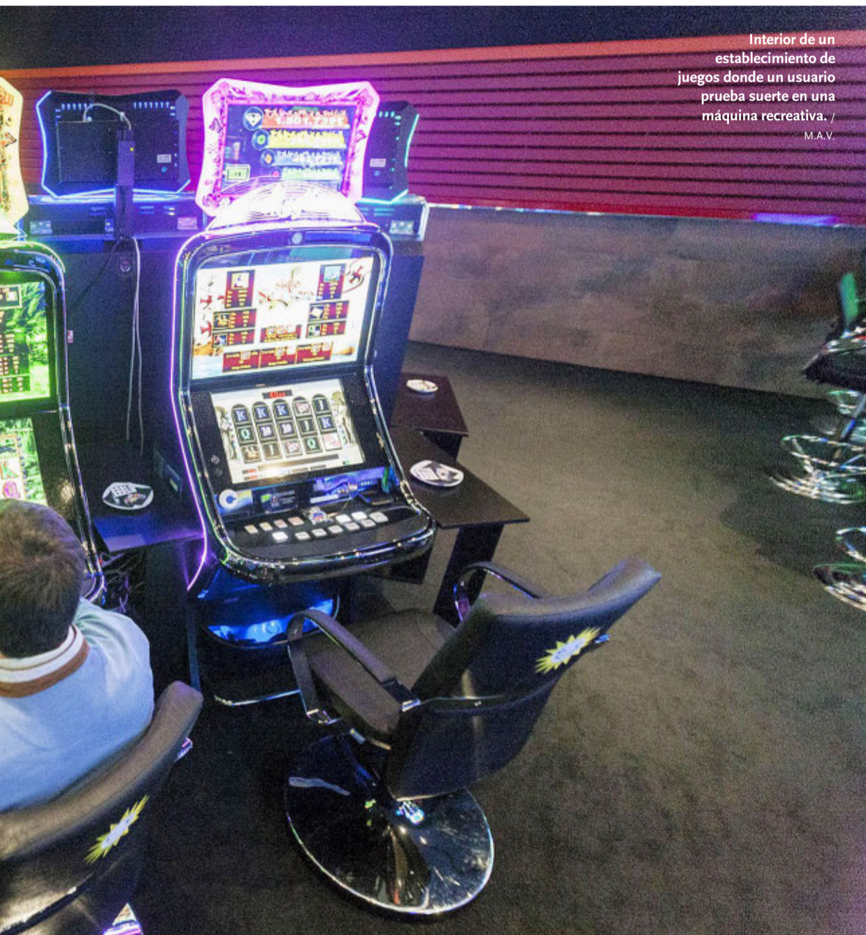
Interior de un establecimiento de juegos donde un usuario prueba suerte en una máquina recreativa.

brá ofertas interesantes, que se presentarán las últimas novedades, que el personal de los concesionarios es tremendamente amable y profesional... pero a mí no hay quien me haga cambiar de opinión: mi Cuatro Latas es sagrado y no lo cambio ni un un SUV, ni por una berlina, ni por un todocamino o por un familiar. ¡Pues no estoy contento con mi cochecete! / MOCHILERO