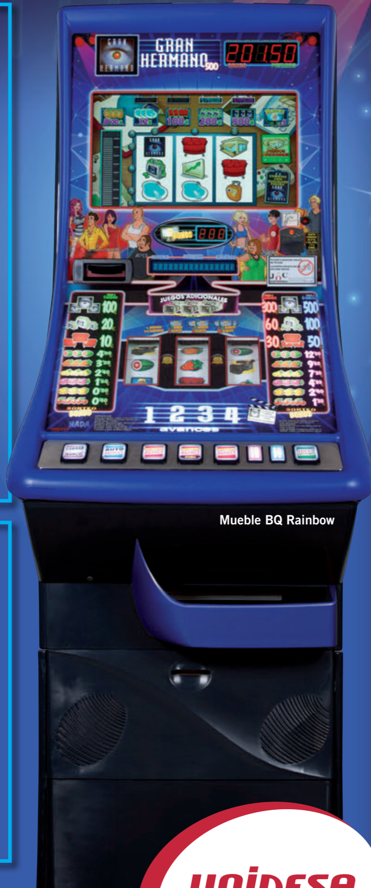
Mueble BQ Rainbow